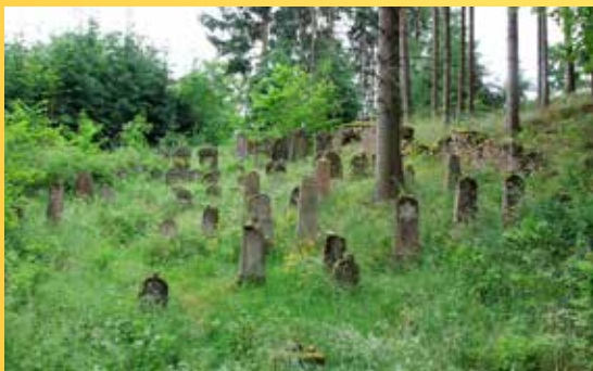
Židovský hřbitov v Úbočí, 22. 6. 2021.