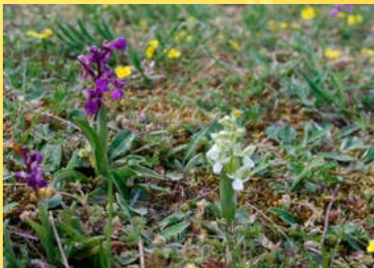
Vstavač kukačka na Komorní Hůrce, klasická a bílá forma, 2. 5. 2018.