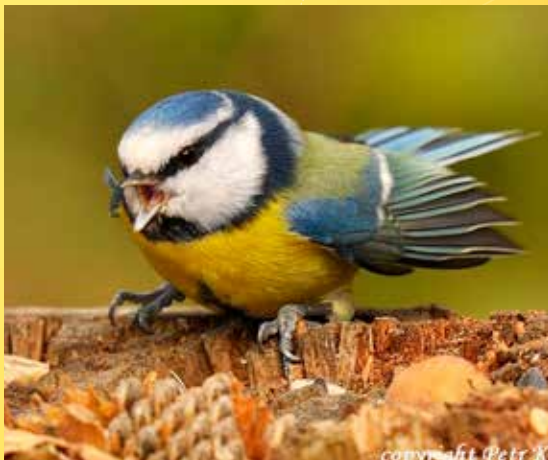
Sýkora modřinka.

Poznámka: Obuv a oblečení do terénu, dalekohled vítán.