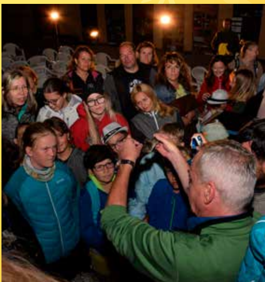
Netopýří noc ve Světcích, 2. 9. 2022.