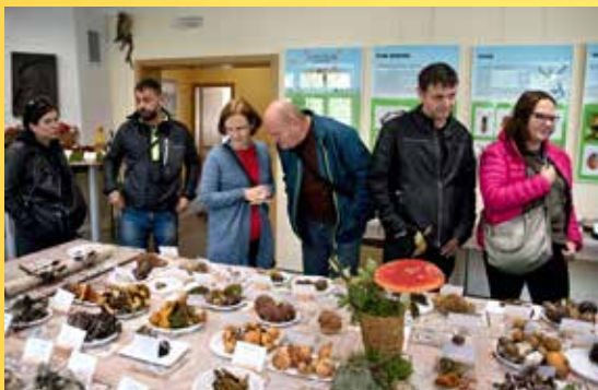
Výstava hub na Správě CHKO Slavkovský les v Mariánských Lázních.

Poznámka: *sobota 9:00–17:00, neděle 9:00–16:00