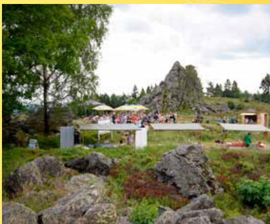
Den Zeleného pásu, Stadlern, 4. 6. 2022.

Poznámka: Více informací před akcí, sledujte zelenypas.bbkkult.net.