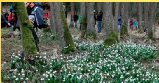
Bledule jarní v PR Petrovka, 29. 3. 2015.

Poznámka: Oblečení do terénu, vhodná je vodě odolná obuv.