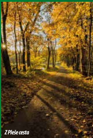
Z Pleše cesta