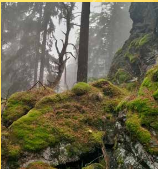
Napříč Slavkovským lesem.

Poznámka: Nutná je vhodná obuv a oblečení do terénu. Nezapomeňte na dostatek tekutin a jídla na celý den. Doporučujeme vzít si s sebou mapu pro případ dřívějšího návratu nebo nutného rozdělení skupiny. Vzhledem k tomu, že nemusíme dojít za světla, je vhodné mít také baterku. Pro značnou náročnost nemůžeme akci doporučit svátečním chodcům. Účastníci se akce účastní na vlastní nebezpečí.