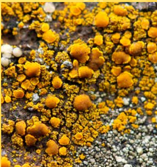
Svícníček žlutkový ( Candelariella vitellina ).