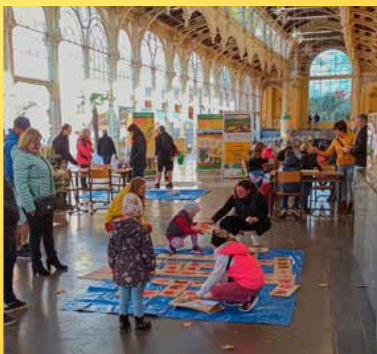
Lázeňský festival jablek v Mariánských Lázních.

Poznámka: Podrobný program bude včas upřesněn na slavkovskyles.nature.cz .