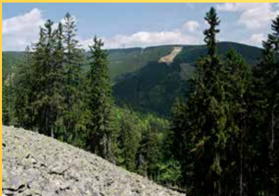
Panorama ze sutí na Hadí hoře, 11. 5. 2022.

Poznámka: Postup na vrchol Hadí hory vede strmým kamenným mořem a je velmi náročný. Doporučujeme neklouzavou obuv s pevnými kotníky (pohorky).