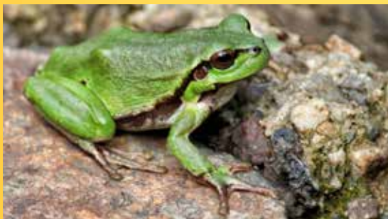
Rosnička zelená, 1. 5. 2019.