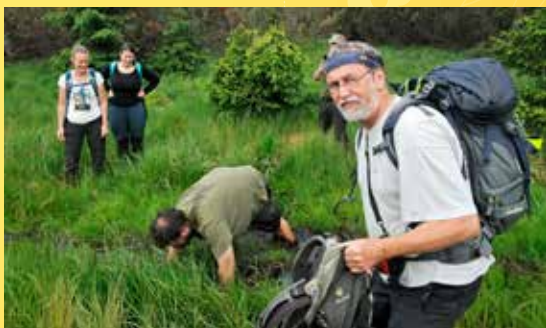
Prameniště Rolavy, 25. 6. 2022.

Obuv do podmáčeného terénu a pláštěnku sebou. Vzhledem k podmáčenému a poddolovanému terénu zanechtejte, prosím, děti a domácí mazlíčky doma.