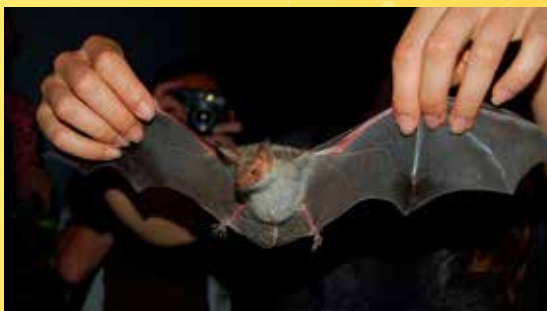
Netopýr velký.

Poznámka: Baterku, terénní obuv a teplé oblečení. Další podrobnosti k programu budou včas upřesněny na slavkovskyles.nature.cz .