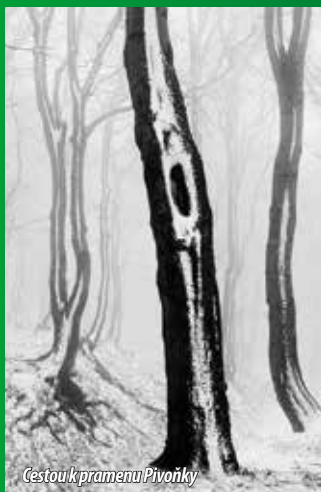
Čestou k pramenu Pivoňky