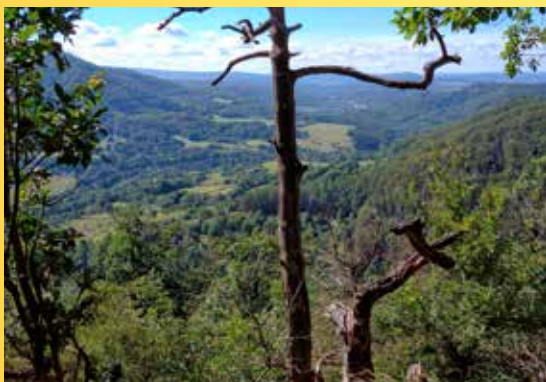
NPR Nebesa.