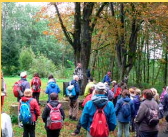
Vycházka k Pleši, 27. 9. 2020.