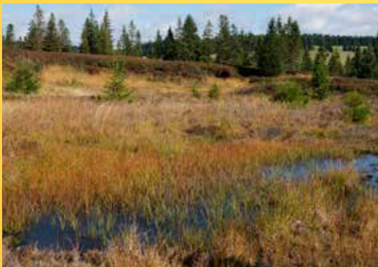
Přebuzské vřesoviště, 17. 9. 2010.