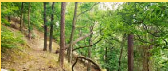
Karlův hvozď.

Poznámka: Je nutné oblečení a obuv do terénu, dále svačina a dostatek tekutin.