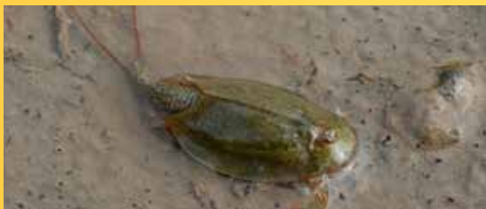
Listonoh letní.