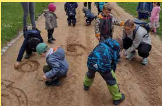
Z exkurze Za měkkýši do zámeckého parku.