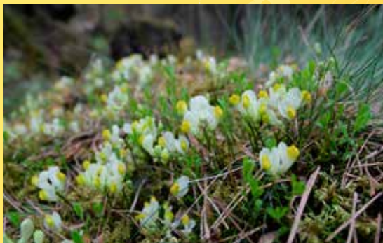
Zimostrázek alpský v Drahotínském lese.