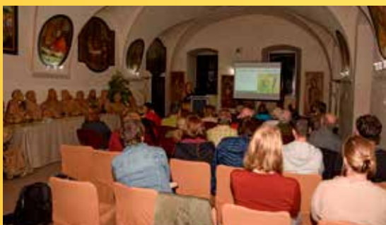
Setkání příznivců Českého lesa v Tachově, 6. 10. 2022.

Poznámka: Další podrobnosti najdete před akcí na ceskyles.nature.cz . Na akci jsou zváni všichni, kdo se zajímají o přírodu v Českém lese.