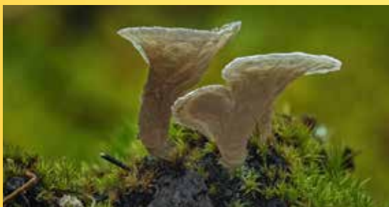
Mecháček lopatkovitý ( Arrhenia spathulata ), houba parazitující na meších.